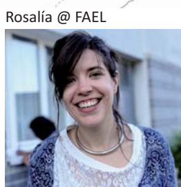
Rosalía @ FAEL