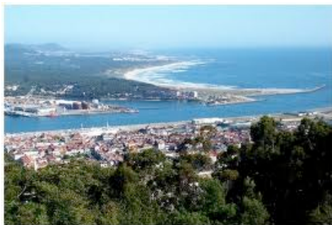
Viano do Castelo