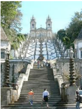
Celerico de Basto